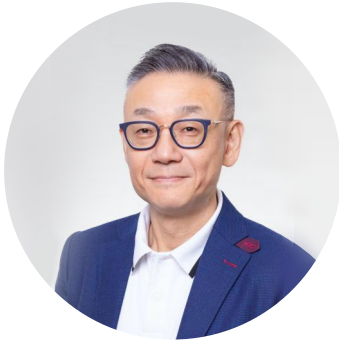
澳門通股份有限公司 董事會主席兼總經理