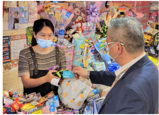
澳門電子消費優惠計劃首日，使用澳門通支付場景。