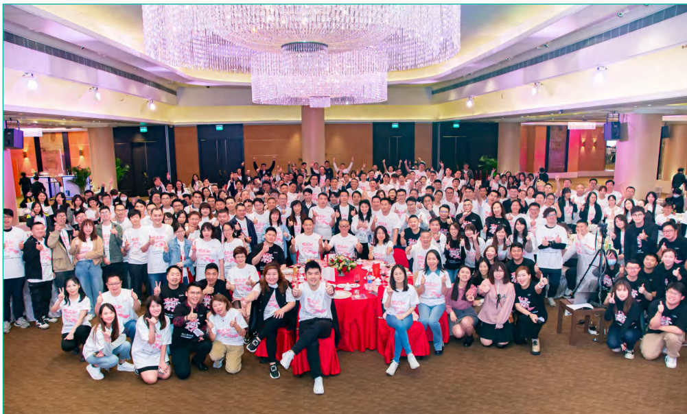
2023年亞博科技年會暨澳門通交割周年慶，內地、港、澳同學齊聚一堂。