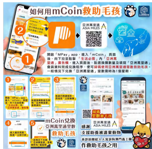
mCoin亞洲萬里通救助毛孩

本公司一直重視慈善活動的參與，多年來我們已資助多項慈善活動。澳門通亦透過產品和服務來積極支援和參與其他機構組織的社會公益及慈善捐贈活動。於MPay產品內，澳門通設置有「愛心捐款」功能，MPay用戶可透過「愛心捐款」向澳門紅十字會、澳門扶康會、人人流浪狗澳門義工團等慈善機構發起愛心捐獻，支持公益。2022年度澳門通與國泰航空「亞洲萬里通」合作，累積「亞洲萬里通」里數參與「善心回饋」計劃，通過兌換mCoin，救助人人流浪狗澳門義工團（附屬）人人康寧善終犬舍中被遺棄的老年、患病動物。