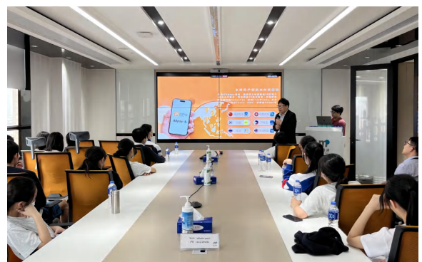
澳門培正中學應用科學組別同學參訪澳門通