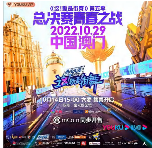
mCoin作為兌換平台，支持熱門綜藝《這！就是街舞》第五季澳門總決賽。

2022年10月29日優酷街舞競技真人秀節目《這！就是街舞》第五季總決賽在澳門威尼斯人酒店金光綜藝館舉行，作為澳門地區票務支援平台，澳門通MPay在其平台上提供相當數量的可通過mCoin積分兌換購買的《街舞》總決賽門票。這是澳門通充分發揮線上線下場景勢能的一次重要嘗試。