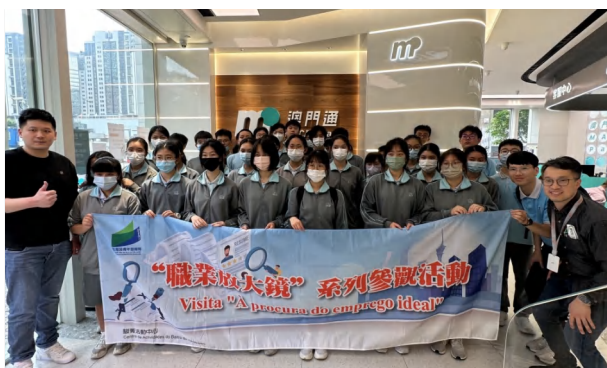
澳門中華學生聯會總會到訪澳門通